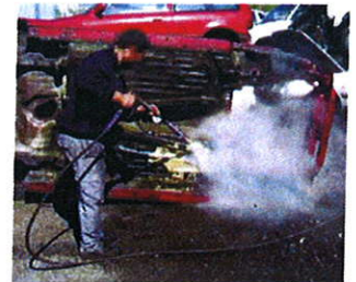
2 - S'élimine par rinçage à l'eau sous pression.