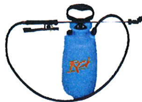
1 - S'utilise pur en pulvérisation ou par brossage.

NATUFORCE s'utilise pur en pulvérisation ou par brossage. Il peut être dilué dans de l'eau jusqu'à 50%. S'élimine par rinçage à l'eau sous pression.