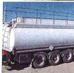
Camions de distribution de gas-oil, fuel, fuel lourd