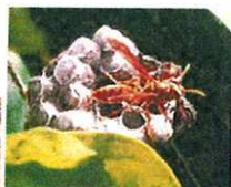
Nid de guêpes