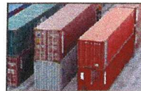
Protection des containers