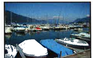
Protection des bateaux et yachts