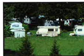
Protection des caravanes et des bungalows