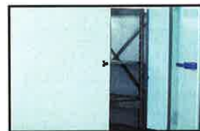
Protection des chambres froides