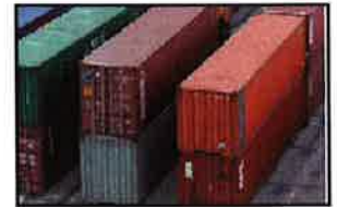
Protection des containers