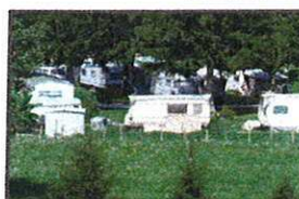
Protection des caravanes et des bungalows