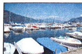
Protection des bateaux et yachts